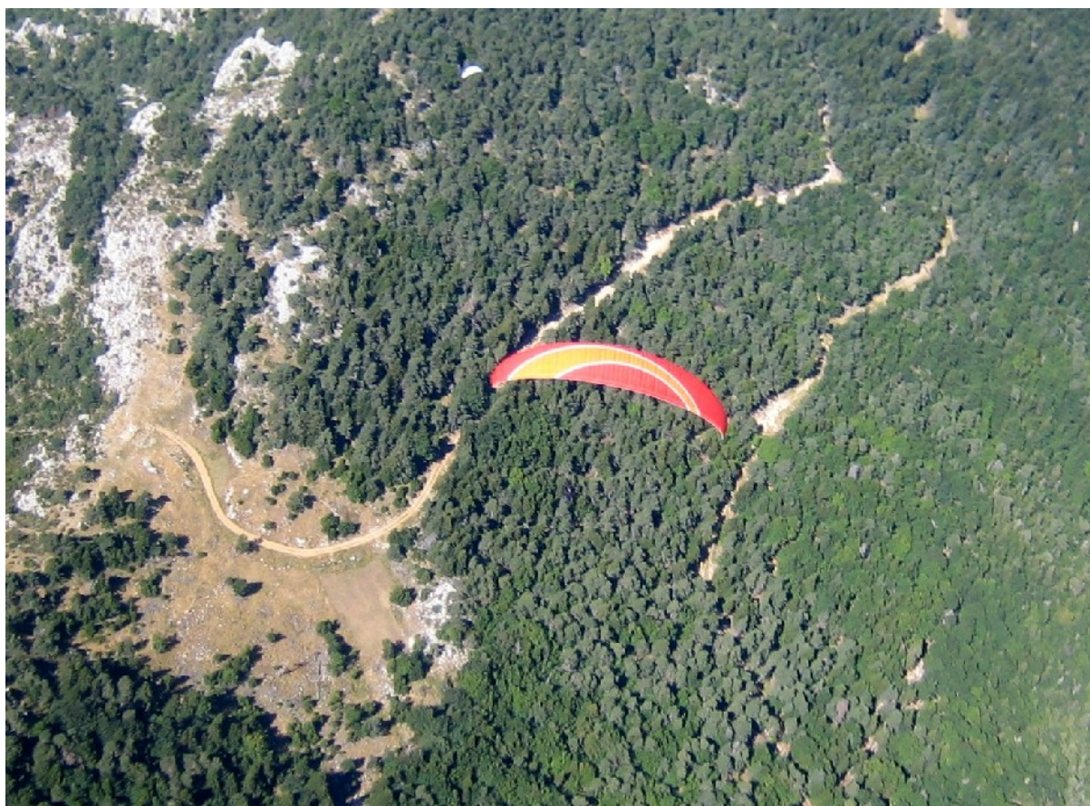
L'extrados de Luc

Nous prenons les ascendances dans les premiers rochers. Les thermiques sont assez larges. Il n'y a pas de cumulus pour l'instant. Grand ciel bleu autour de nous. Toutes les chaînes de montagne sont bien dessinées. Le spectacle est garanti pour moi mais nous ne sommes pas assez haut au goût de Victor. Nous enroulons les ascendances avant le Pic de L'aigle. De là, nous voyons Luc au niveau de Fourneuby qui se rapproche rapidement de nous pendant que nous continuons à enrouler. Luc passe sous nous. Oui, oui, on a vu l'extrados de Luc, photo à l'appui!!