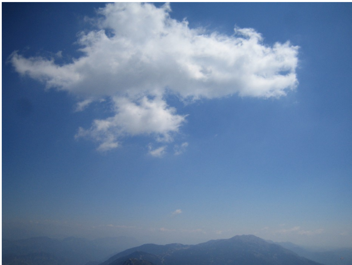
Le cum qui nous assurera la transition

Victor m'annonce que notre balade va peut-être se terminer là mais avant il veut essayer au col de Bleine. Et voilà qu'il enroule, enroule, enroule pour arriver au-dessus de déco de Bleine. Super, on a réussi, la balade n'est pas finie!!! Poussés par l'ouest, pourquoi ne pas voler jusqu'à Gréolières ? Le pic de l'aigle nous garanti un bon thermique aboutissant à un magnifique cumulus. Nous montons jusqu'aux barbules à 2300m puis nous contourons le nuage et traversons le plan du Peyron.